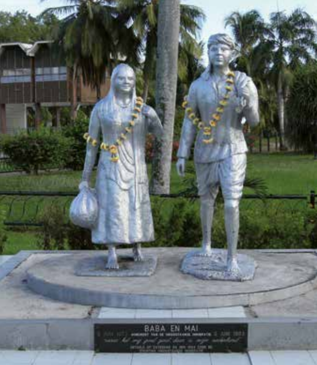
Standbeeld 'Baba en Mai' in Paramaribo, ter herinnering aan de Hindostaanse contractarbeid.

begon de inscheping en kregen de contractarbeiders kleding, attributen (zoals drinkvaten) en een emigratiepas. Op deze pas stonden de gegevens van de arbeider. Er stond bijvoorbeeld de eigen naam, naam van de vader en naaste familie en de geografische herkomst op. Verder was er sprake van een strakke indeling in het schip. Het schip was ingedeeld in drie delen. In het achtergedeelte op het tussendek van het schip werden de alleenstaande vrouwen geplaatst, gehuwden (families met kinderen) werden ingekwartierd in het middengedeelte en de alleenstaande mannen zaten in het voorste gedeelte van het schip.