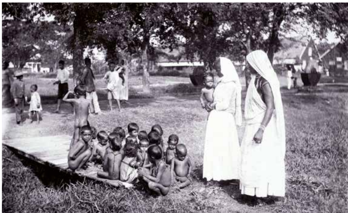
Kinderbewaarpplaats (kinderdagverblijf) met Hindostaanse kinderen en vrouwen van Brits-Indische afkomst op de suikerplantage Mariënborg in het district Commewijne, ca. 1910. Linkerpagina: Brits-Indiase contractarbeiders, waarschijnlijk in Suriname rond 1900.

Het historische verschijnsel van contractarbeid in de Nederlandse kolonies was niet alleen beperkt tot de Hindostaanse gemeenschap. Zo waren er al in 1853 kleine groepen contractarbeiders uit China, Madeira, Barbados en andere landen aan het werk in Suriname. Tevens werden er vanaf 1890 op grote schaal Javanen vanuit Nederlands-Indië vervoerd naar het land. Dit geeft wel aan hoe groot en veelzijdig het historische verschijnsel is. In dit artikel is ervoor gekozen om de focus op de contractarbeiders van Indiase afkomst te leggen.